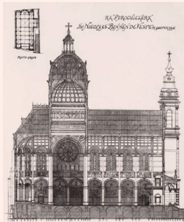
Bouwtekening van architect Adriaan Bleys, 1885.

lieke begrippen een markante kerk. Als eigenwijze leerling van Pierre Cuypers besloot hij te breken met de neogotische traditie van kerkenbouw waarop zijn leermeester patent had. Die traditie verwees naar het katholieke bloeitijdperk in de Middeleeuwen. De jongere architect kon zich niet verenigen met de vanzelfsprekendheid van deze bouwstijl en zag de neogotiek als het ongeïnspireerd en ondoordacht kopiëren van een oude stijl. Hij gaf de voorkeur aan een combinatie van vormen en verbond de emancipatie van de Amsterdamse katholieken met neorenaissance en -barok.