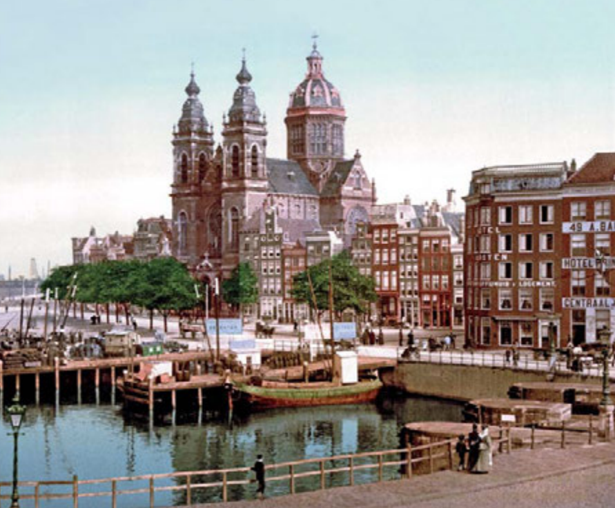
De kerk is net drie jaar geleden geopend als deze overzichtsfoto van de Prins Hendrikkade wordt gemaakt vanaf de Nieuwe Brug over het Damrak.