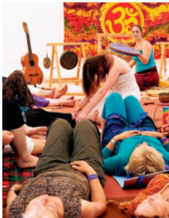
Een healing tijdens workshop Engelenzang.

Vragend naar de betekenis van spiritualiteit tijdens deze drie dagen verwijst de oprichter naar een beschrijving in de festivalkrant waarin staat dat het gaat om een “fundamentele levensoriëntatie van waaruit zin wordt gegeven aan zowel individuele als collectieve ervaringen. Spiritualiteit helpt mensen een diepere betekenis van de werkelijkheid te onderkennen en de verplichting die daar vanuit gaat serieus te nemen.”